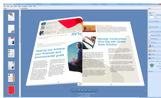
Xerox® Integrated Fieri® Color Server

* Опциональный комплект: Стойка, монитор, клавиатура и мышь