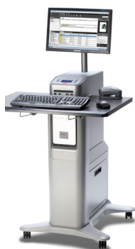
Xerox® EX Print Server, Powered by Fieri®*