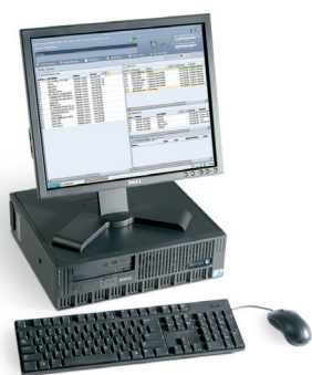
Xerox® FreeFlow® Print Server

Каждый сервер предназначен для соответствия определенным требованиям к рабочему процессу и конкретным вариантам применения. Представитель компании Xerox поможет выбрать сервер, лучше всего адаптированный к вашим потребностям.