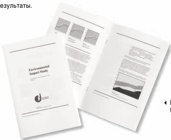
◀ НАПЕЧАТАННЫЕ БРОШЮРЫ

Эффективный документ — это не просто печатный лист бумаги. Разнообразные опции послепечатной обработки, такие как режимы сшивания, изготовления брошюр, Z-фальцовки, С-фальцовки, двойной фальцовки, а также вставки листов и полноцветных обложек обеспечивают оснащённость Xerox WorkCentre Pro 4110 для изготовления высококачественных и эффективных документов, позволяющих получить требуемые результаты.