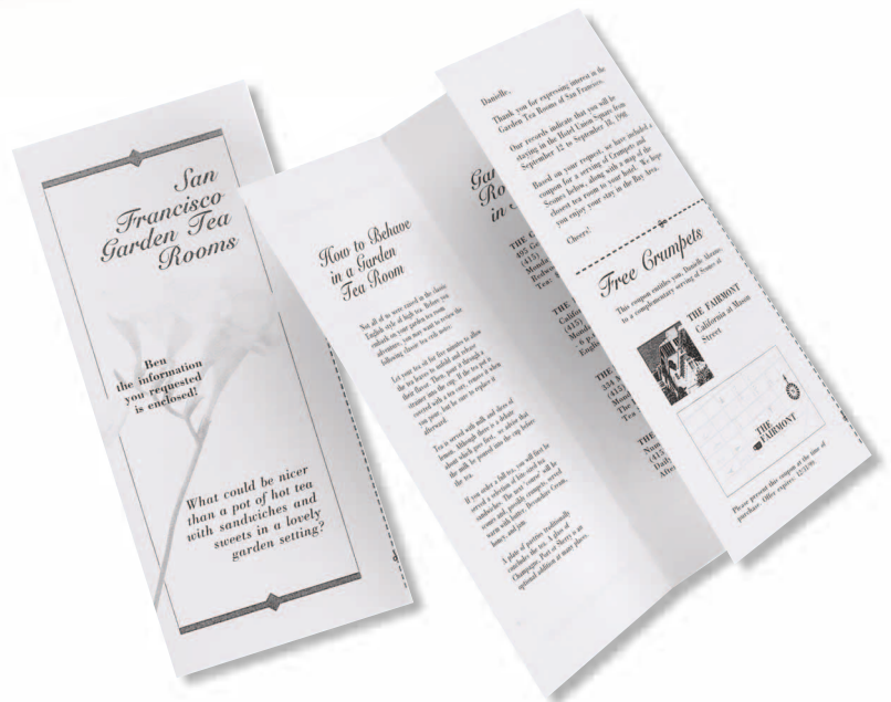
▲ С- И Z-ФАЛЬЦОВКА